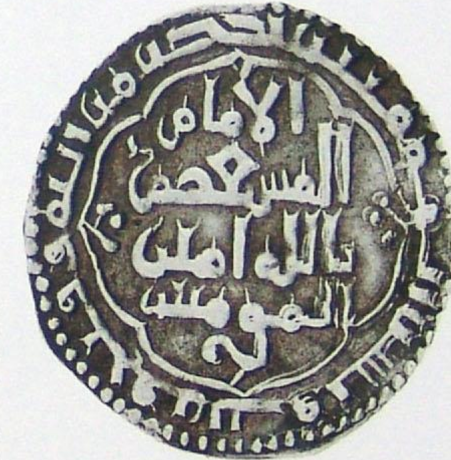
درهم عباسي المعتصم بالله ضرب: مدينة السلام سنة: ٦٤١ هجري

At the time of the Khalifah Al-Ma'moun a new text was added that is "Allah is the supreme ruler before and after and the faithful will rejoice at the victory given by Allah". The names of the cities where the coins were minted were also mentioned on the Dinars.